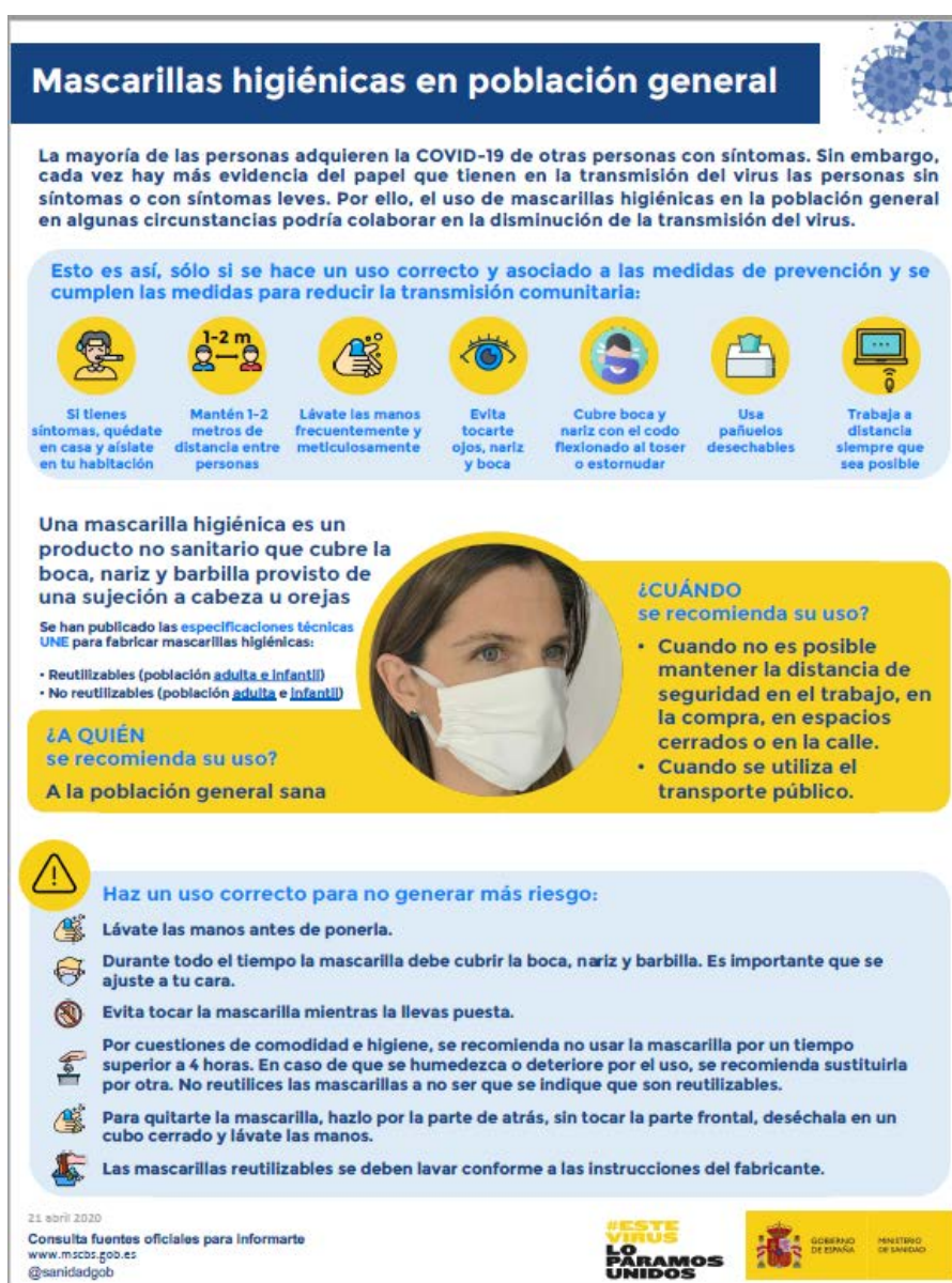
Mascarillas higiénicas en población general (Ministerio de Sanidad, Consumo y Bienestar Social, 2020)

Nota: las mascarillas quirúrgicas y las mascarillas higiénicas no son consideradas EPI.